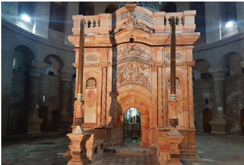
Ὁ Πανάγιος Τάφος τοῦ Χριστοῦ, «ἡ πηγή τῆς ἡμῶν ἀναστάσεως»

Τό ζήτημα τῆς καύσης τῶν νεκρῶν ἐξακολουθεῖ νά διχάζει πολλούς στή χώρα μας, παρά τό γεγονός ὅτι θεωρεῖται σήμερα λελυμένο, τόσο ἐκ μέρους τῆς Πολιτείας, ὅσο καί ἐκ μέρους τῆς Ἐκκλησίας. Ἡ μέν Πολιτεία ἐπιτρέπει πλέον καί νομικά τήν καύση τοῦ σώματος μετά τόν θάνατο σέ ὄσους τό ἐπιθυμοῦν, ἡ δέ Ἐκκλησία ἐμμένει σταθερά στήν παραδοσιακή ἀποψη ὅτι ἡ καύση τῶν νεκρῶν δέν εἶναι ἐπιτρεπτή στά μέλη της, τοὺς Ὁρθοδόξους πιστούς. Γιά τήν ἀκρίβεια, ἡ Ὁρθόδοξη Ἐκκλησία δέχεται ὅτι δέν ὑπάρχουν «νεκροί», ἀλλά «κεκοιμημένοι», πού ἀναμένουν τήν ἀφύπνισή τους στή μελλοντική ἀνάσταση τῶν σωμάτων. Ὡστόσο, θεωρήσαμε σκόπιμο νά ἀσχοληθοῦμε μέ τό θέμα ἐπειδή, α) κάποιες χριστιανικές ὁμολογίες καί αἵρέσεις ἀποδέχονται τήν καύση τῶν νεκρῶν, θεωρώντάς την πράξη σύμφωνη μέ τή χριστιανική Παράδοση καί β) κάποιοι Ὁρθόδοξοι πιστοί ἐπιλέγουν τήν πράξη αὐτή, εἴτε ἀπό ἄγνοια, εἴτε ἀπό λανθασμένη ἐκτίμηση, θέλοντας ὅμως νά παραμένουν μέλη τῆς Ἐκκλησίας, νά ψάλλεται ἡ Ἐξόδιος Ἀκολουθία τους, νά τελοῦνται τά Μνημόσυνά τους κ.λπ. Εἶναι εὐνόητο, ὅτι ἡ θέση τῆς Ἐκκλησίας ὡς πρός τό ζήτημα αὐτό ἀφορᾶ στά μέλη της καί σέ καμμιά περίπτωση δέν ἀποβλέπει στό νά ἐκβιάσει τίς ἀπόψεις ἄλλων συνανθρώπων μας, ἀθέων, ἑτεροθρήσκων, ἑτεροδόξων κ.λπ., τήν ἐλευθερία γνώμης τῶν ὁποίων σέβεται ἀπόλυτα.